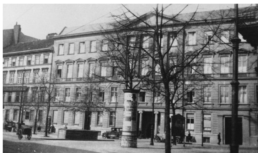
Gründungsurkunde und Haus 1924